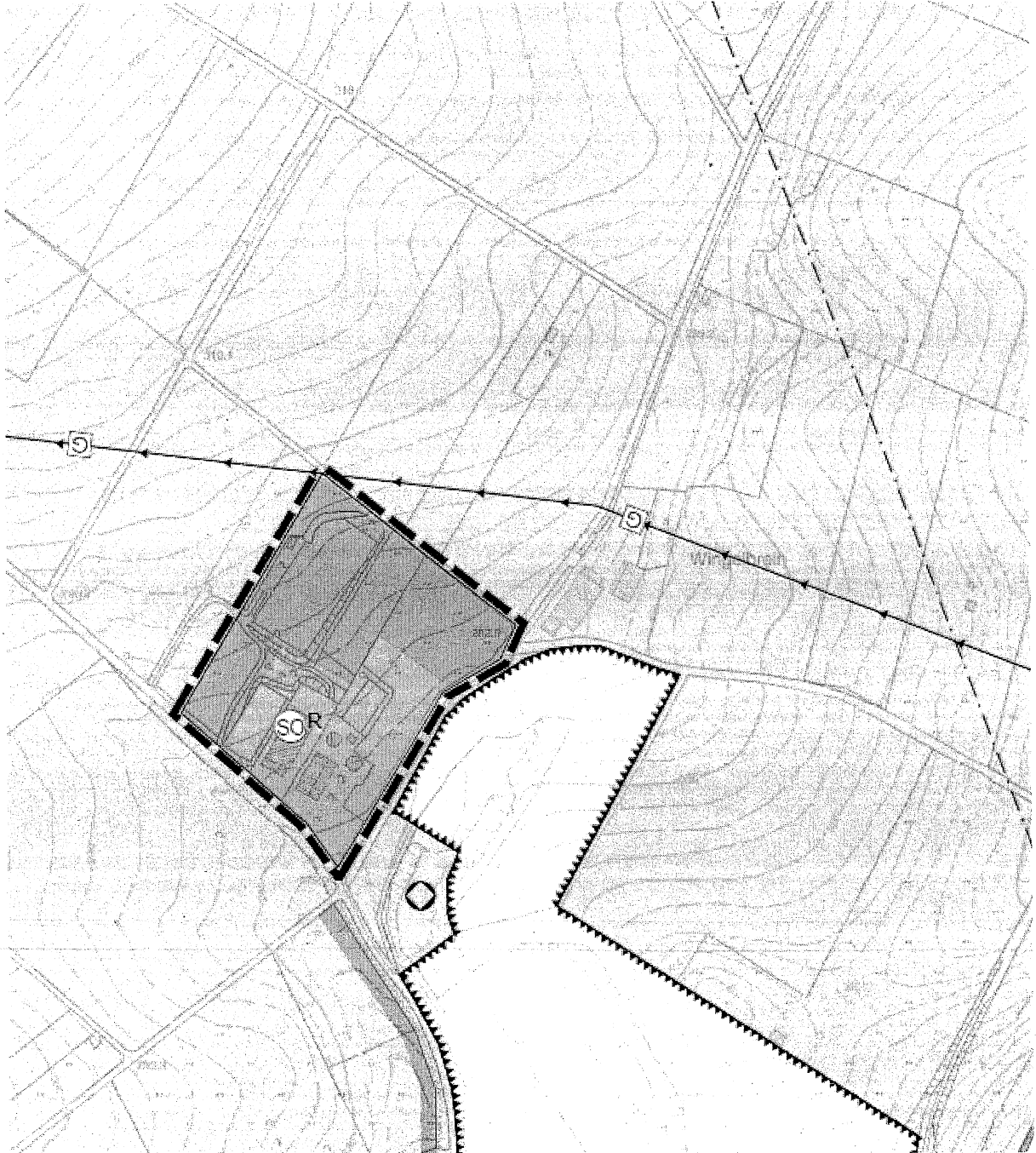
Übersichtsplan (ohne Maßstab und ohne Planaussagen) zum Geltungsbereich der Flächennutzungsplanänderung - Der Änderungsbereich ist mit einer Strichlinie umrandet dargestellt